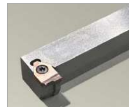
スロアウェイチップ (インサートチップ) 成形

汎用旋盤向けのJIS標準規格の超硬ろう付けバイトや端面溝加工バイトなどの特殊品の超硬ろう付けバイトを製作しています。