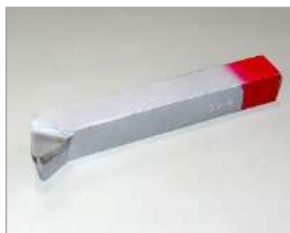
JIS 超硬ろう付けバイト