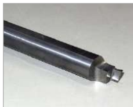
端面溝入れバイト