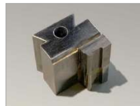
ダブルテールバイト